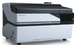
Inductively Coupled Plasma Mass Spectrometer ICPMS-2030