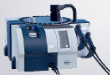
MPA – FT-NIR spektrometr