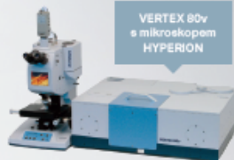
VERTEX 80v s mikroskopem HYPERION