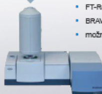
MultiRam FT-Raman spektrometr